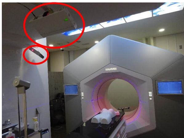
Align RT (体表面位置合わせ)